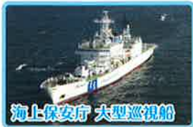
海上保安庁 大型巡視船

一般公開 7月23日(土)・24日(日) 10:00~15:30(受付終了) 開催場所 神野ふ頭3号岸壁