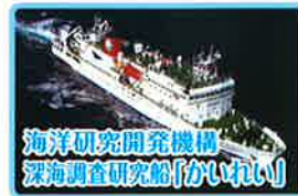
海洋研究開発機構 深海調査研究船「がいりい」

一般公開 7月17日(日)・18日(月・祝) 10:00~15:30(受付終了) 開催場所 神野ふ頭3号岸壁