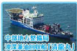
中部地方整備局 浅深兼油回収船「清龍丸」

一般公開 7月23日(土)・24日(日) 10:00~15:30(受付終了) 開催場所 神野ふ頭3号岸壁