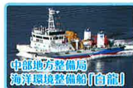
中部地方整備局 海洋環境整備船「自龍」

一般公開 ※セイルドリルとは帆を張る訓練のことです 7/30(土)10:00~15:30(受付終了) (セイルドリル)7/31(日)13:00~16:00 (ライトアップ)7/30(土)日没~20:30 開催場所 神野ふ頭3号岸壁