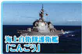
海上自衛隊護衛艦 「こんごう」

一般公開 7月16日(土)13:00~15:00(受付終了) 7月17日(日)・18日(月・祝) 10:00~15:00(受付終了) 開催場所 神野ふ頭7号岸壁