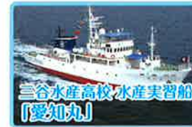
三谷水産高校 水産実習船 「愛知丸」

一般公開 7月17日(日) 10:00~15:30(受付終了) 開催場所 神野ふ頭3号岸壁