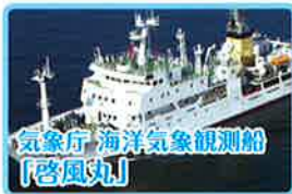
気象庁 海洋気象観測船 「啓風丸」

一般公開 7月16日(土)13:00~15:00(受付終了) 7月17日(日)・18日(月・祝) 10:00~15:00(受付終了) 開催場所 神野ふ頭7号岸壁